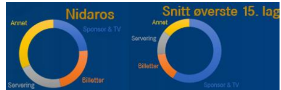
Figur 1 Kakediagram av inntektsfordeling

Utfordringen med inntektsgrunnlaget til klubben er at det er for marginale inntekter som kommer fra sponsorer. Klubben ligger på ca. 25% av inntektsgrunnlaget fra sponsorer. Nasjonalt ligger i snitt de 15. største ishockeyklubbene i Norge på et forhold på ca. 50-60%. I snitt ligger også andre eliteklubber i Trondheim på samme forhold. Skal derfor Nidaros Hockey lykkes med å ta løftet og kjempe i toppen av norsk ishockey må vi bli bedre på å få med samarbeidspartnere.